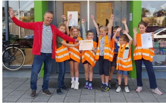
Uitreiking bronzen certificaat aan De Triangel