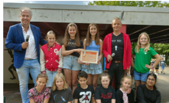
Uitreiking bronzen certificaat aan De Regenboog