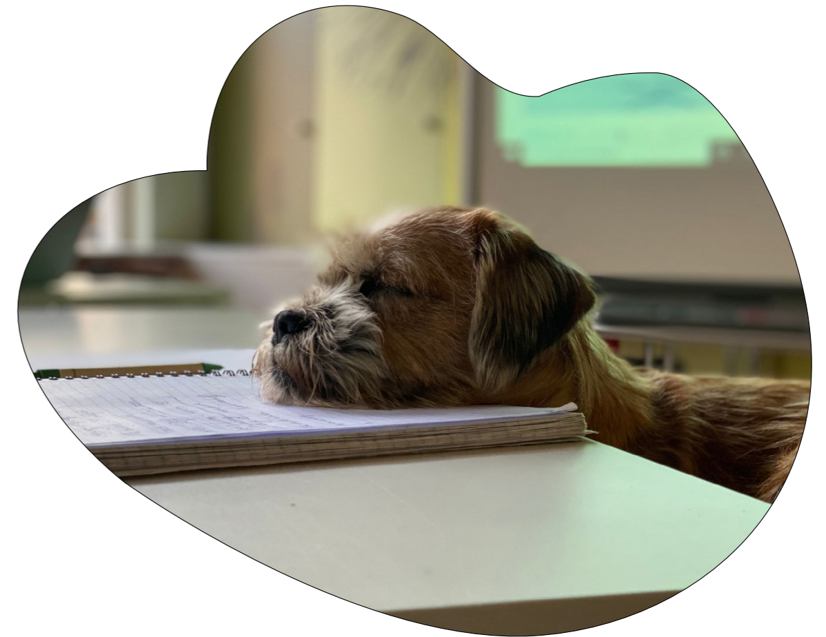
Onze viervoetige vrijwilliger Fonzie...