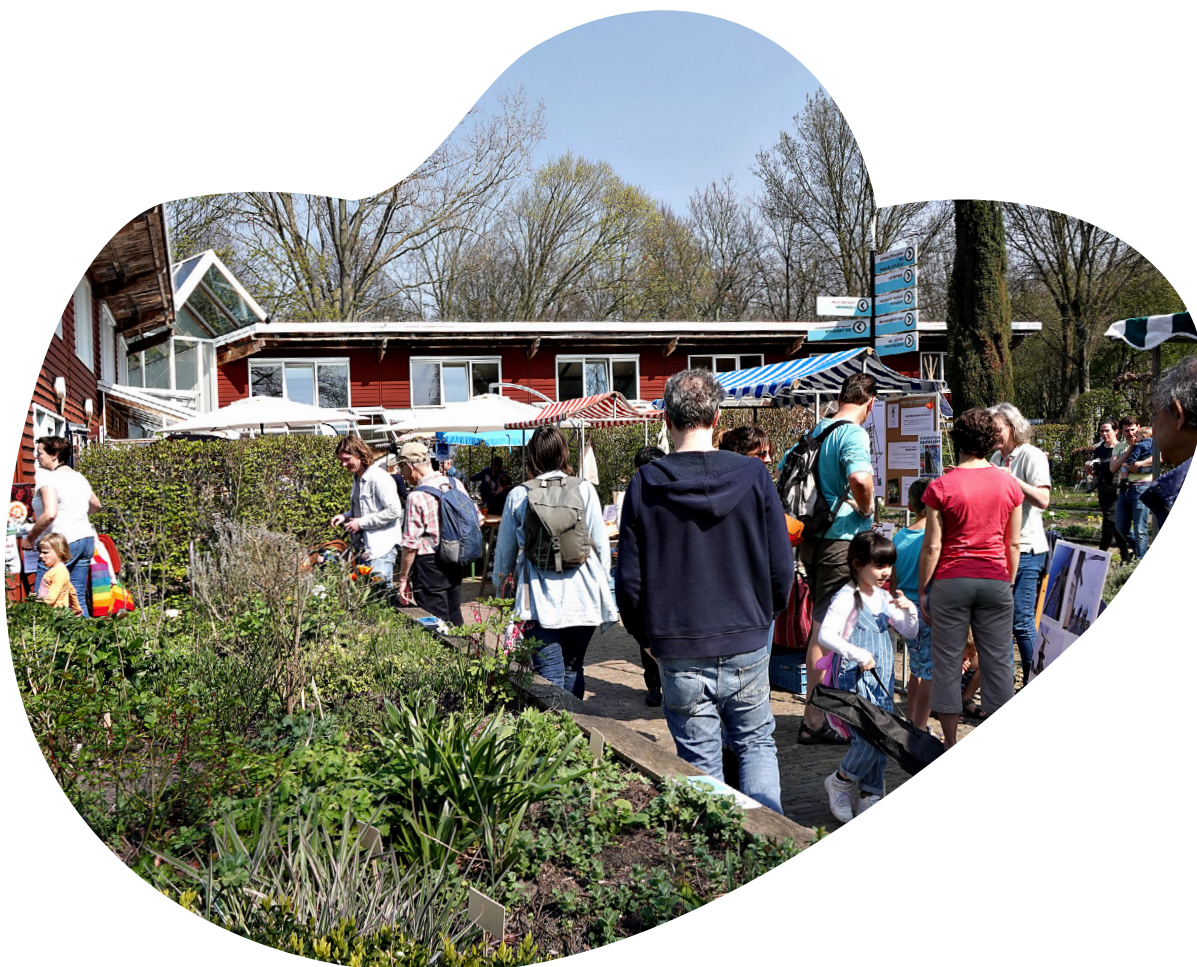
Lentefair bij De Papaver