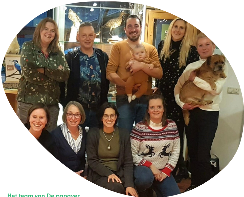
Het team van De papaver