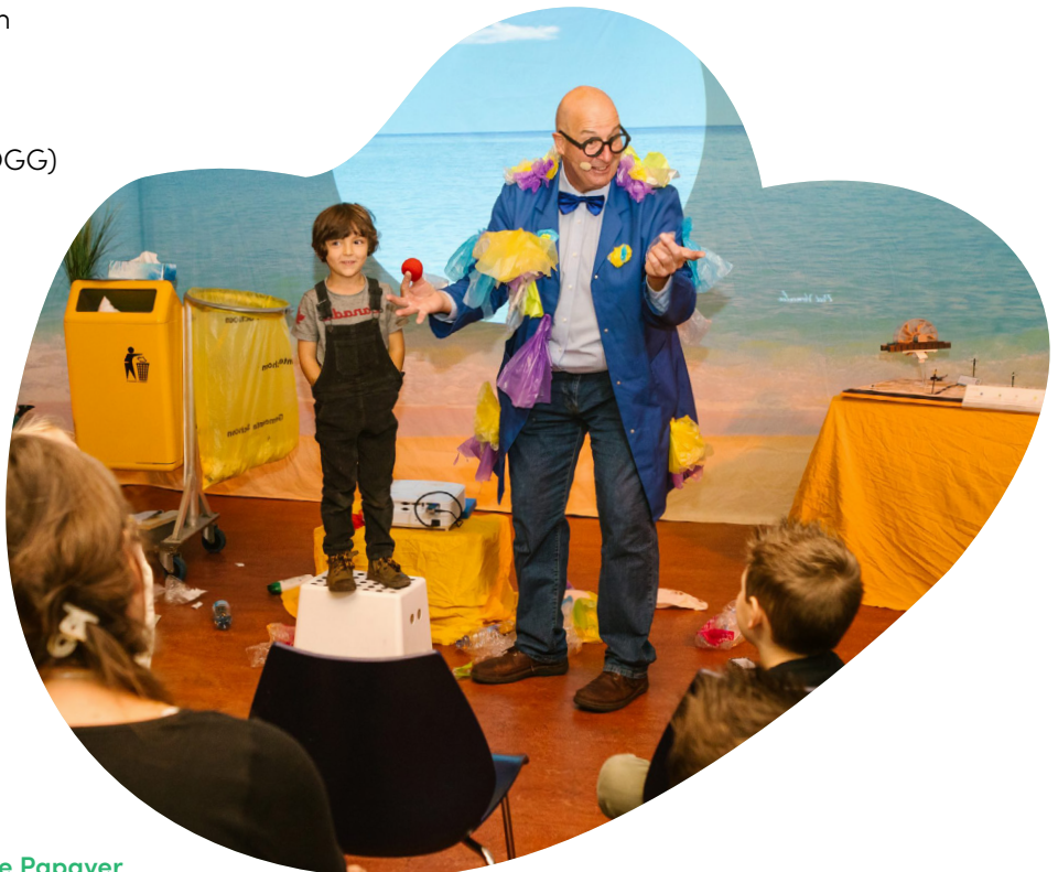
Cultuurbarbaren bij De Papaver